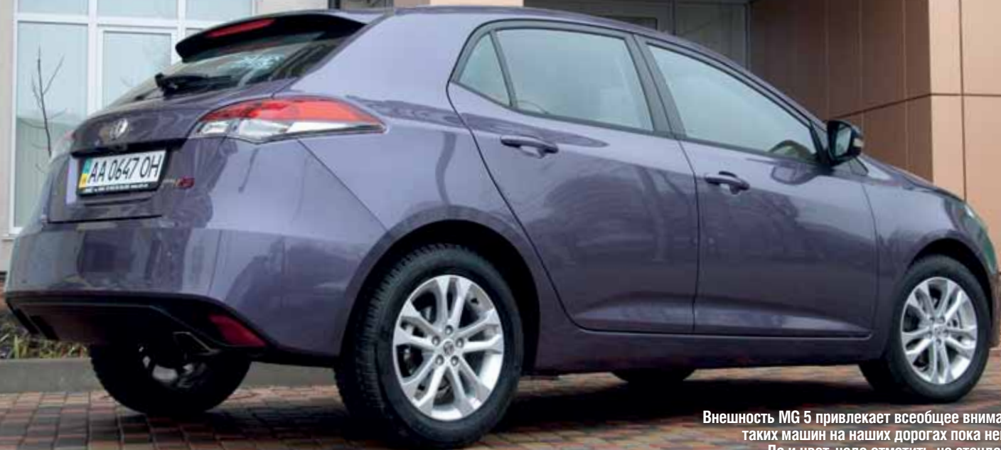
Внешность MG 5 привлекает всеобщее внимание — таких машин на наших дорогах пока немного. Да и цвет, надо отметить, не стандартный