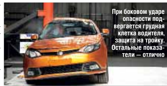
При боковом ударе опасности подвергается грудная клетка водителя, защита на тройку. Остальные показатели — отлично