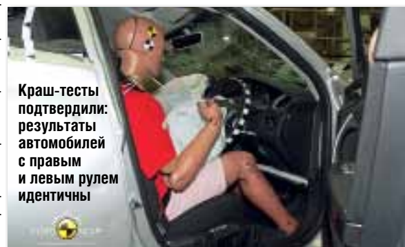
Краш-тесты подтвердили: результаты автомобилей с правым и левым рулем идентичны