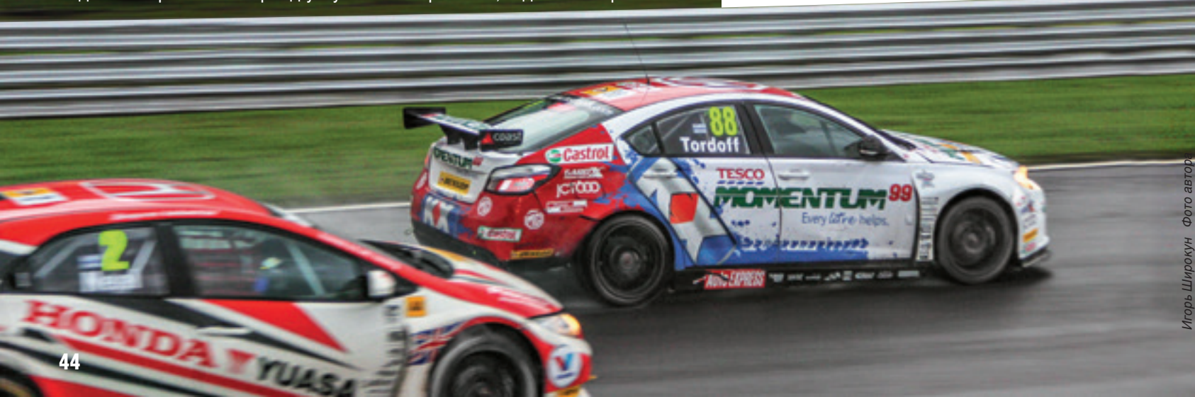
Игорь Широкин Фото автора