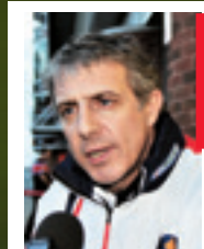
Джейсон Плато MG KX Momentum Racing