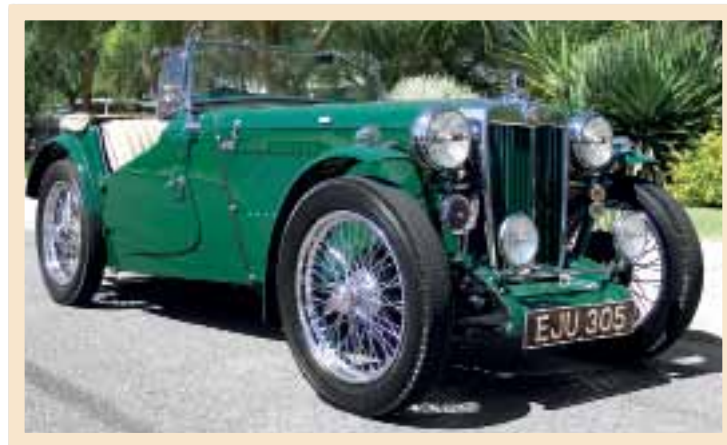
▲ Тщательно отреставрированный MG TA/TB на сегодняшний день оценивается в 30–40 тысяч евро

лями. Среди них была и представленная в 1933 году новинка K-типе Magnette с еще более скромной 1,1-литровой «шестеркой». Короткобазная гоночная версия K3 с компрессорным двигателем стала самым известным представителем семейства Magnette. Дебютировав в престижной гонке Mille Miglia она одержала победу в классе и в командном зачете.