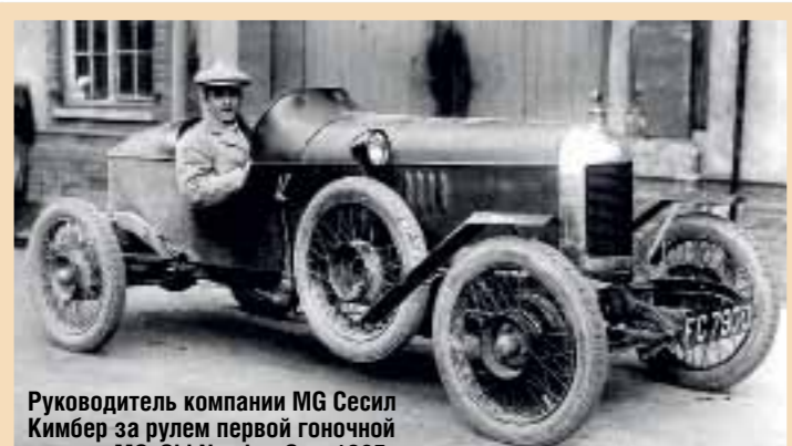
Руководитель компании MG Сесил Кимбер за рулем первой гоночной модели MG, Old Number One, 1925 год

Отечественные покупатели пока мало знакомы с брендом MG. Однако он имеет богатую историю и всего через пару лет будет отмечать свой девяностый юбилей