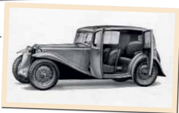
► Для MG K-type Magnette компания предлагала кузова двух типов — 4-местный родстер и 4-дверный седан без центральной стойки