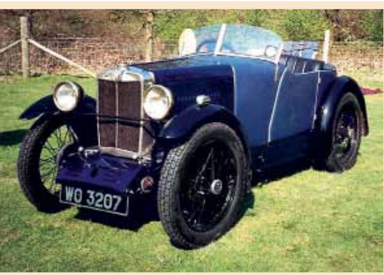
▲ Появление компактного родстера MG M-type Midget позволило компании пережить экономический кризис